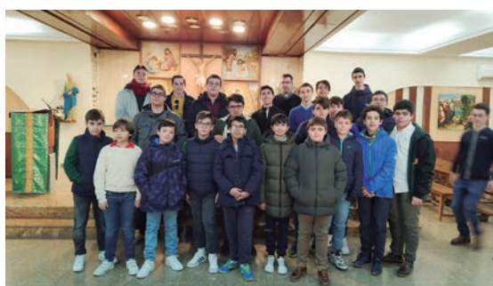
Convivencia con jóvenes del Seminario Menor