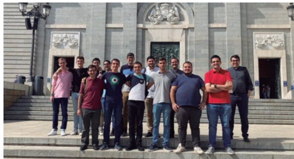
Excursión a Madrid del Seminario Mayor