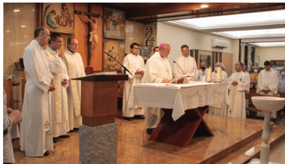
Toma de posesión en la parroquia de San Pablo