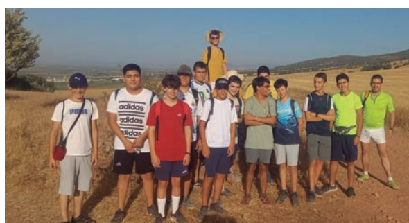
Salida al campo del Seminario Menor